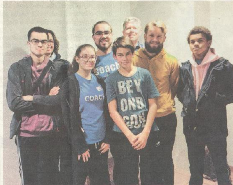
Das Abendteam nach der ersten Veranstaltung dieses Jahres.